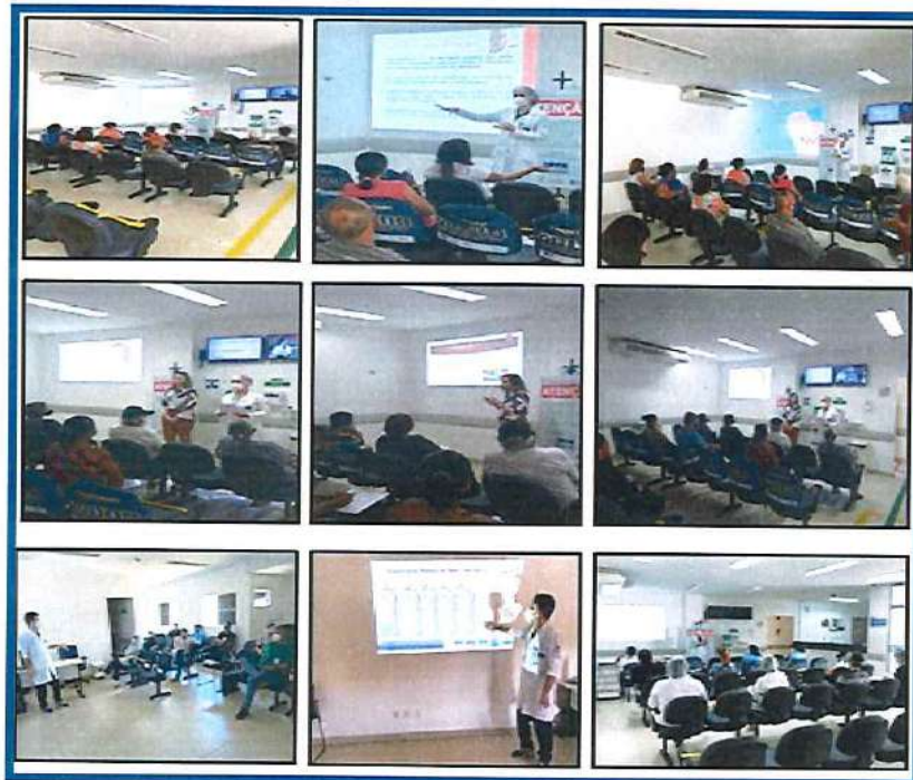
Figura 07 - Eventos Agosto 2020