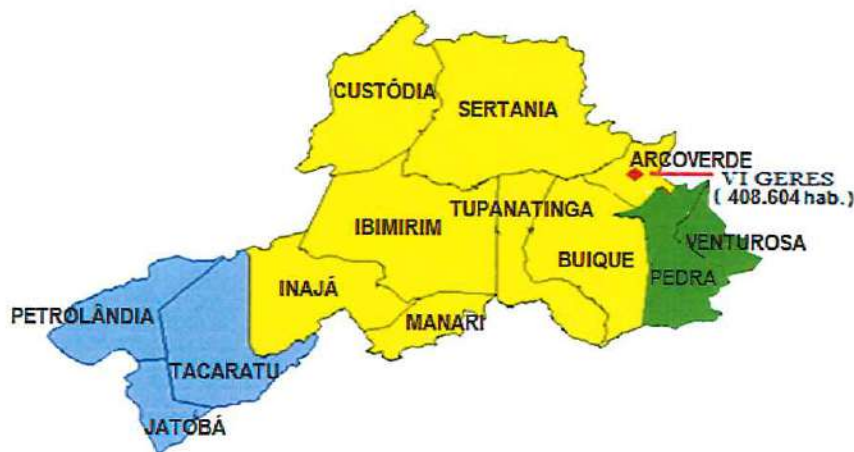
Figura 01 - Mapa

referência para 13 municípios (Arcoverde, Buíque, Custódia, Sertânia, Ibimirim, Inajá, Jatobá, Manarí, Pedra, Petrolândia, Tacaratu, Tupanatinga, Venturosa). Os pacientes serão regulados pela VI Geres, totalizando uma população de aproximadamente 408.604 mil habitantes (DATASUS, 2014).