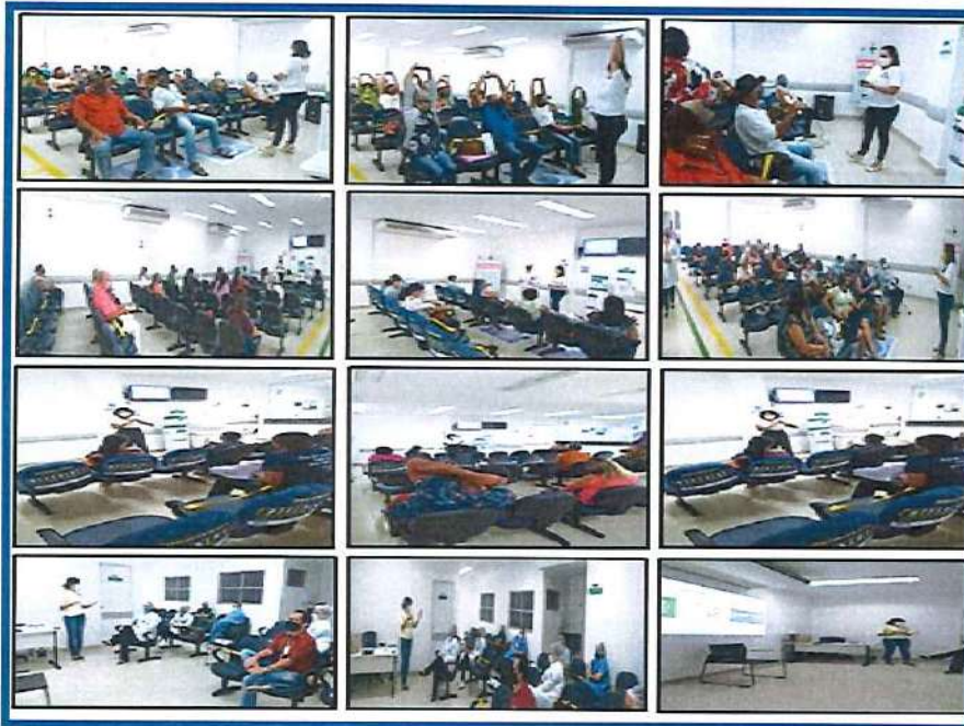
Figura 8 - Eventos Setembro 2020