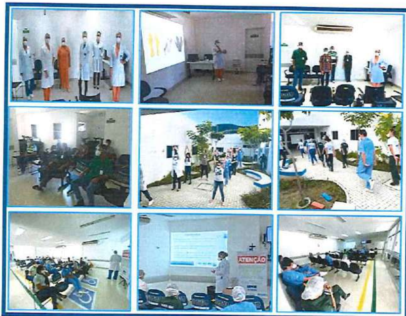
Figura 06 - Eventos Julho 2020