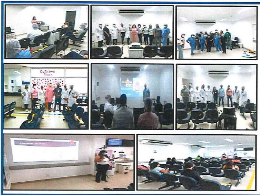
Figura 9 - Eventos Outubro 2020